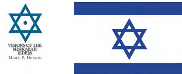
Figuras 2 y 3. Representación de la Merkabah y bandera de Israel

En el proceso de búsqueda de la simbología, se ha encontrado que la estrella de seis puntas también representa otro símbolo, la Merkabah . En la imagen inferior se observan dos estrellas de seis puntas, prácticamente iguales, la de la izquierda es la portada del libro de Mark F. Dennis y representa la Merkabah que también tiene una representación tridimensional; la de la derecha es la bandera de Israel con la estrella de David.