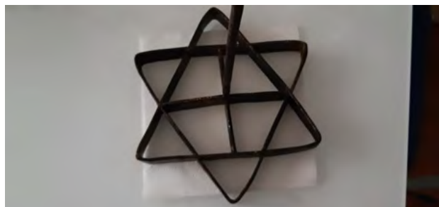
Figuras 4 y 5. Hierros de floreta con 5 y 4 nervios radiales. Colección particular de Lagartera