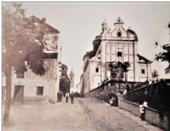
Fig. 3: Antigua iglesia de los jesuitas, actual teatro Palenque que da nombre a la calle. ‘El Castellano Gráfico’, 21-9-1924