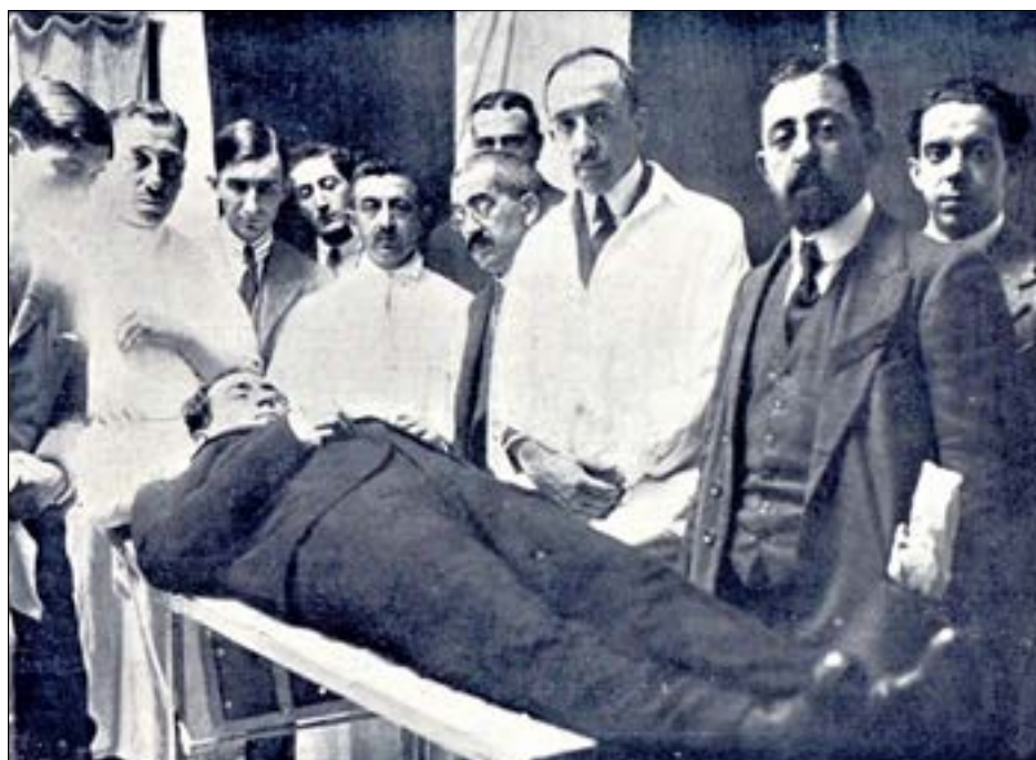
Fig. 10: Joselito de cuerpo presente en la enfermería de la plaza de toros de Talavera (Hernaiz, 1920: 21)