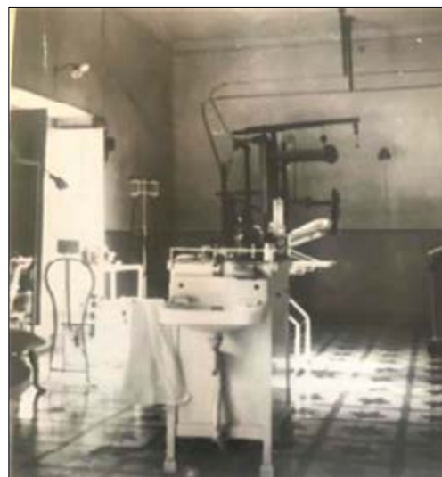
Figs. 5 y 6: Salas e instrumental de la clínica del Dr. Sanguino