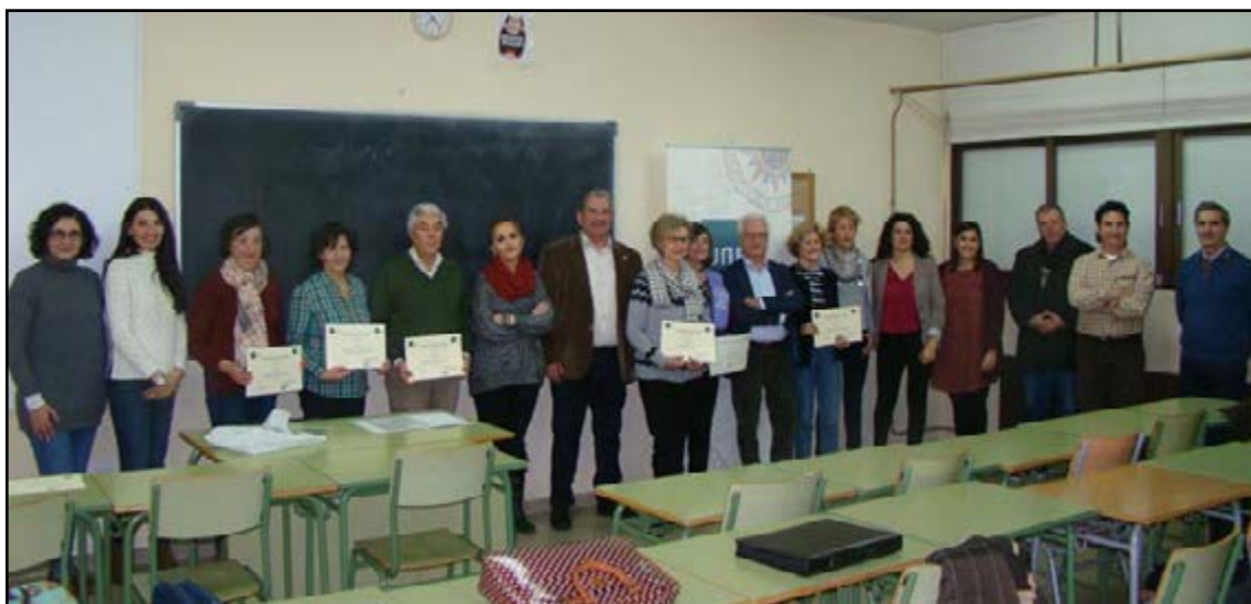
La UNED inaugura un nuevo curso en Quintanar de la Orden. (ELDIAdigital.es 15/11/2019)