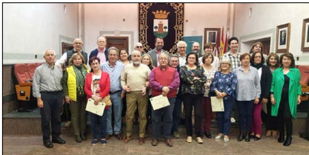
Entrega de diplomas